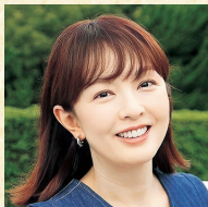
フリーキャスター 丸岡 いずみ氏